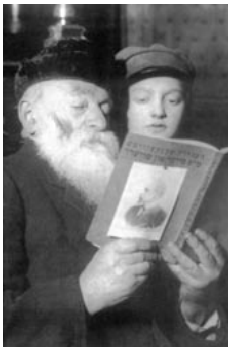
Un grand-père et son petit-fils à Varsovie lisant un roman de Sienkiewicz traduit du polonais en yiddish.

אַ זידע מיט אַן אייניקל אין וואַרשע לייענענדיק אַ ראָמאַן פֿונעם פּוילישן שרעבער שענקעוויטש אין ייִדישער איבערזעצונג.