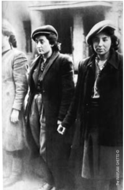
The WARSAW GHETTO ©

פֿאַרזיין אויף ייִדיש: שלום ראָזענבערג. לידער און פּראָזע וועגן חורבן און גבורה, געלייענט אין ייִדיש און פֿראַנצייזיש דורך אַניק פּריס-מאַרגוליס און מירי סיקאַרי. געזאַנגען פֿון געטאָ און קאַמף.