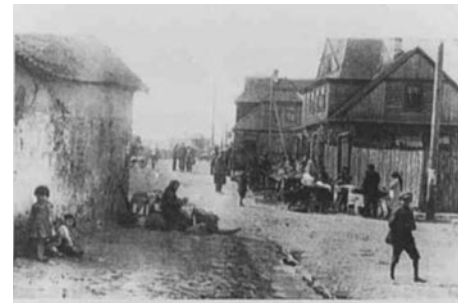
אַ גאַס אין אַסטראַלענקע, וווּ ישראל שטערן איז געבוירן געוואָרן.