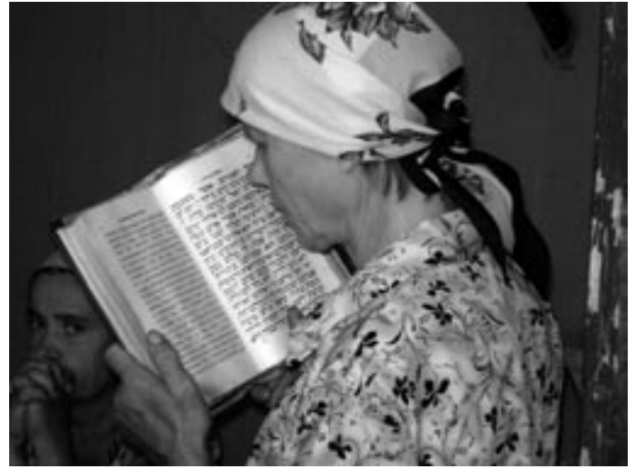
אוקריינישע פֿרויען בײַ אַ רבין אין טשערנאוויץ פֿאַטאָ פֿון אלאן שאַרבאַנעל.