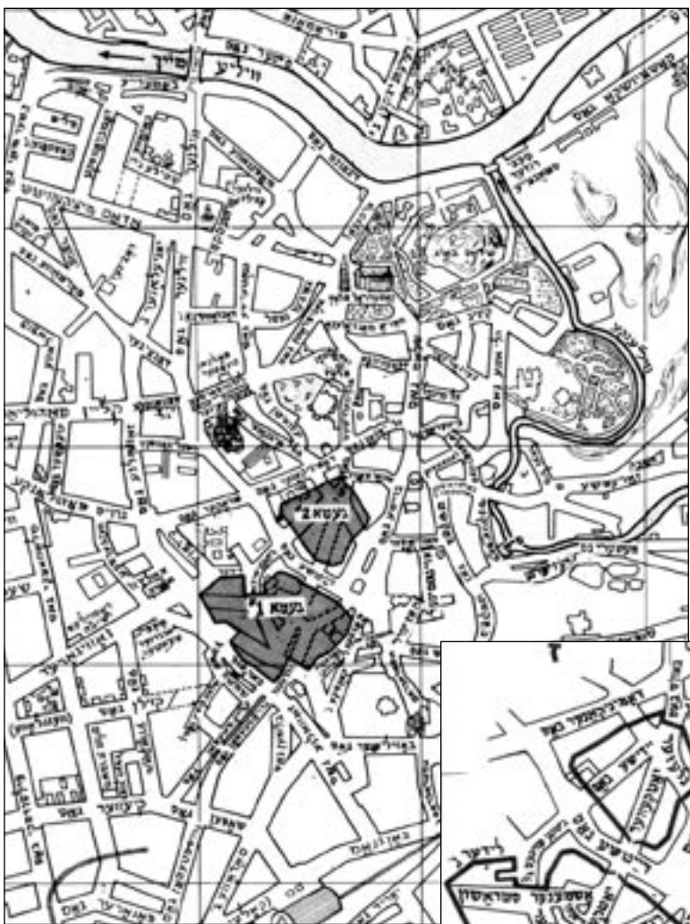
אַ בילד פֿון מעטשיס בראַזאַיטיס