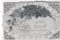
Carte de vœux en hébreu et en allemand, écrite au verso en yiddish, 1924.