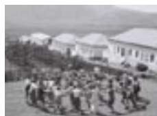
Membres du kibboutz Ein Harod en 1936.

De leur préfiguration sous forme de hakhshores (fermes préparant à la vie agricole et communautaire) en Europe orientale, à leur réalisation en Palestine, devenue pour partie l'État d'Israël en 1948, les kibboutz furent un élément important du mouvement sioniste, proposant une vision idéalisée du «Juif nouveau».