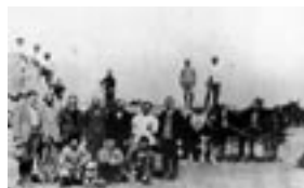
Gauchos juifs originaires d'Europe orientale à Santa Fe, Argentine, autour de 1920.

À partir de 1891, le baron Maurice de Hirsch consacra une partie de son immense fortune à l'émigration des Juifs d'Europe orientale et leur installation dans des colonies agricoles aux États-Unis, puis en Argentine et au Brésil.