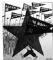
Dessin de William Gropper dans Icor Journal , mai 1934.