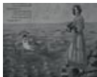
L'engloutissement de la "vieille année" au profit de la "nouvelle année".