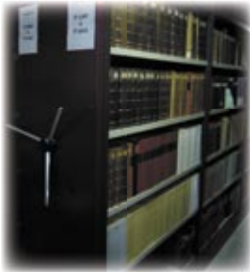
Les étagères coulissantes du sous-sol

Pour assurer le développement des collections, le sous-sol, équipé d'étagères coulissantes, pourra accueillir 30 000 livres supplémentaires.